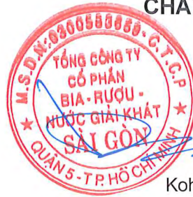
Koh Poh Tiong