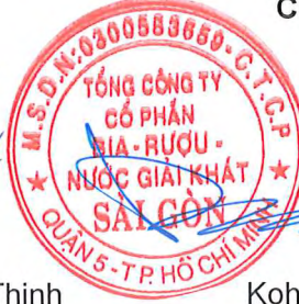
Koh Poh Tiong